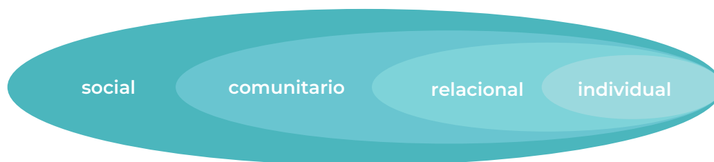
Ilustración 1: Modelo conceptual de la violencia contra la mujer